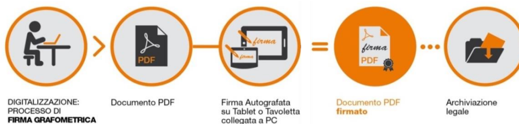
Fig.2 - Schema

I dati cifrati vengono successivamente inseriti nel pdf attraverso la creazione di una firma conforme allo standard europeo denominato PAdES. La soluzione prevede che, a sigillo di ogni firma apposta sul documento dal CLIENTE, sia applicato un certificato rilasciato da NAMIRIAL CA.